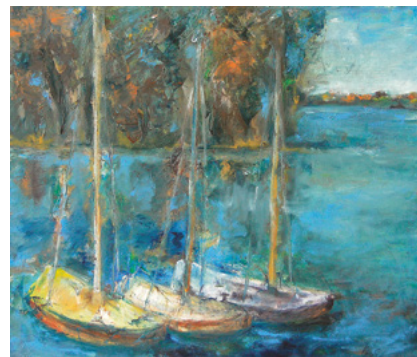
Ingrid Strecker, www.ingrid-strecker.de

Meine zweite Begeisterung gilt dem Ton. Plastiken unterschiedlicher Art und Größe, gebrannt und oft handbemalt, entstehen. Viele Figuren lasse ich in Bronze gießen. In zahlreichen Ausstellungen, auch im Ausland, hatte ich Gelegenheit meine Arbeiten zu präsentieren. Ich freue mich sehr, Ihnen eine Auswahl meiner Bilder hier zeigen zu dürfen.